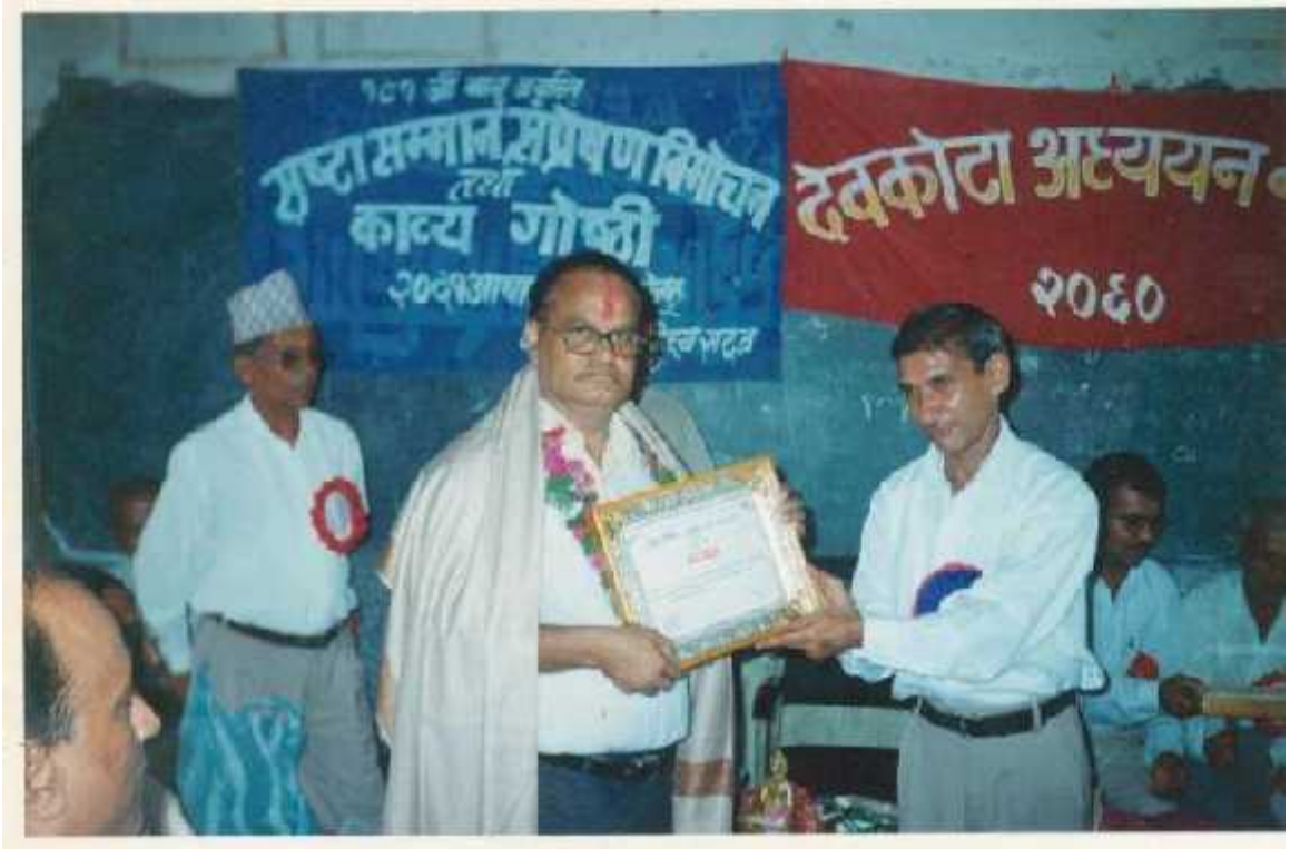
वाल्मीकि साहित्य सम्मान, रत्ननगरद्वारा सम्मान ग्रहण गर्दै