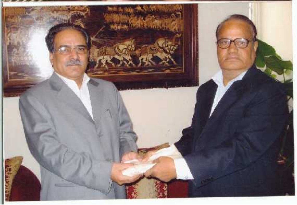
पूर्वप्रधानमन्त्री प्रचण्डलाई आफूद्वारा रचित पुस्तकहरू प्रदान गर्दै