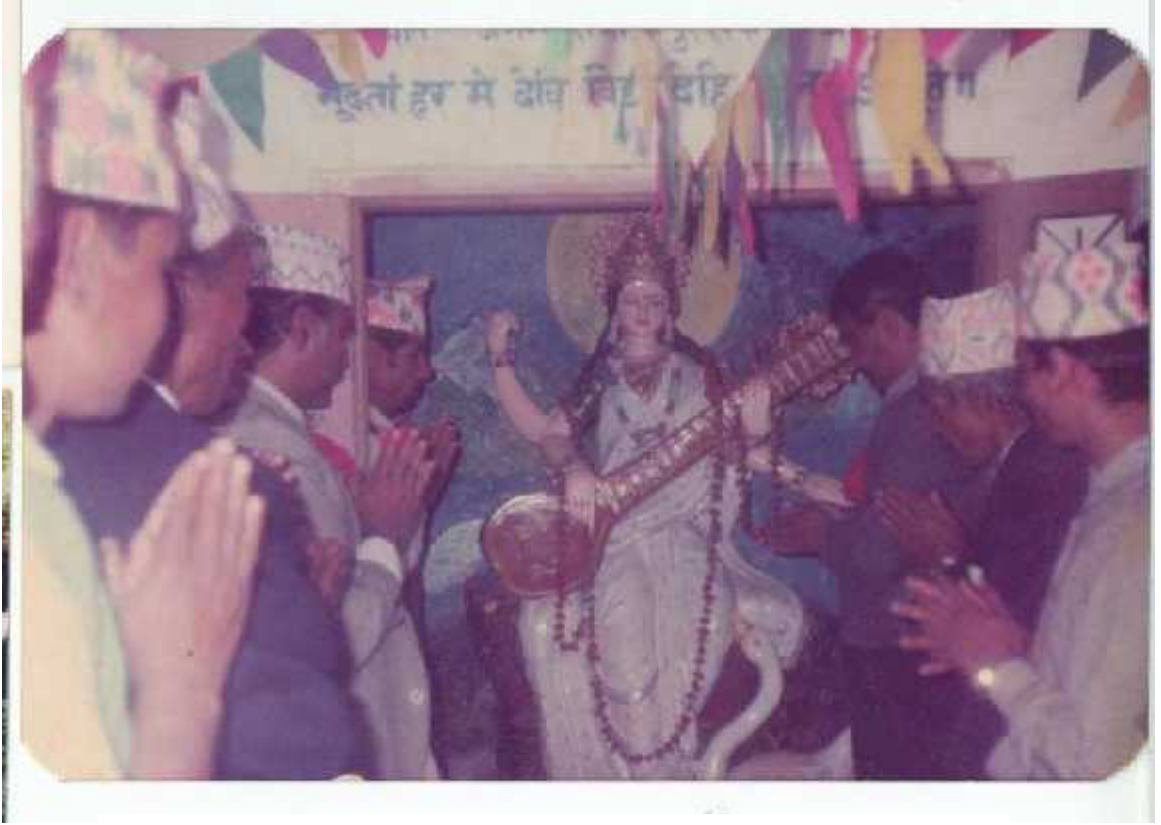
सरस्वतीको प्रतिमा अनावरण गर्दै कँडेल (नारायणी विद्या मन्दिर उच्च माध्यमिक विद्यालय)