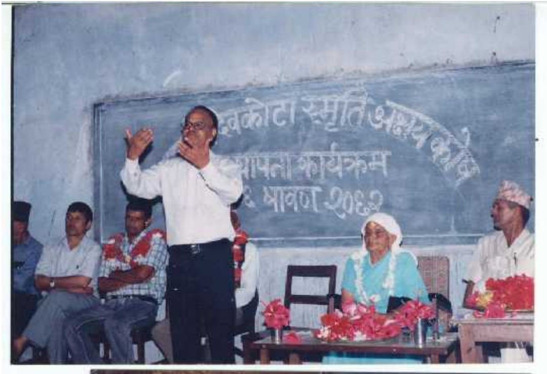
दवकोटा स्मृति अक्षयकोष स्थापना कार्यक्रममा आफ्नो मन्तव्य व्यक्त गर्दै कँडेल