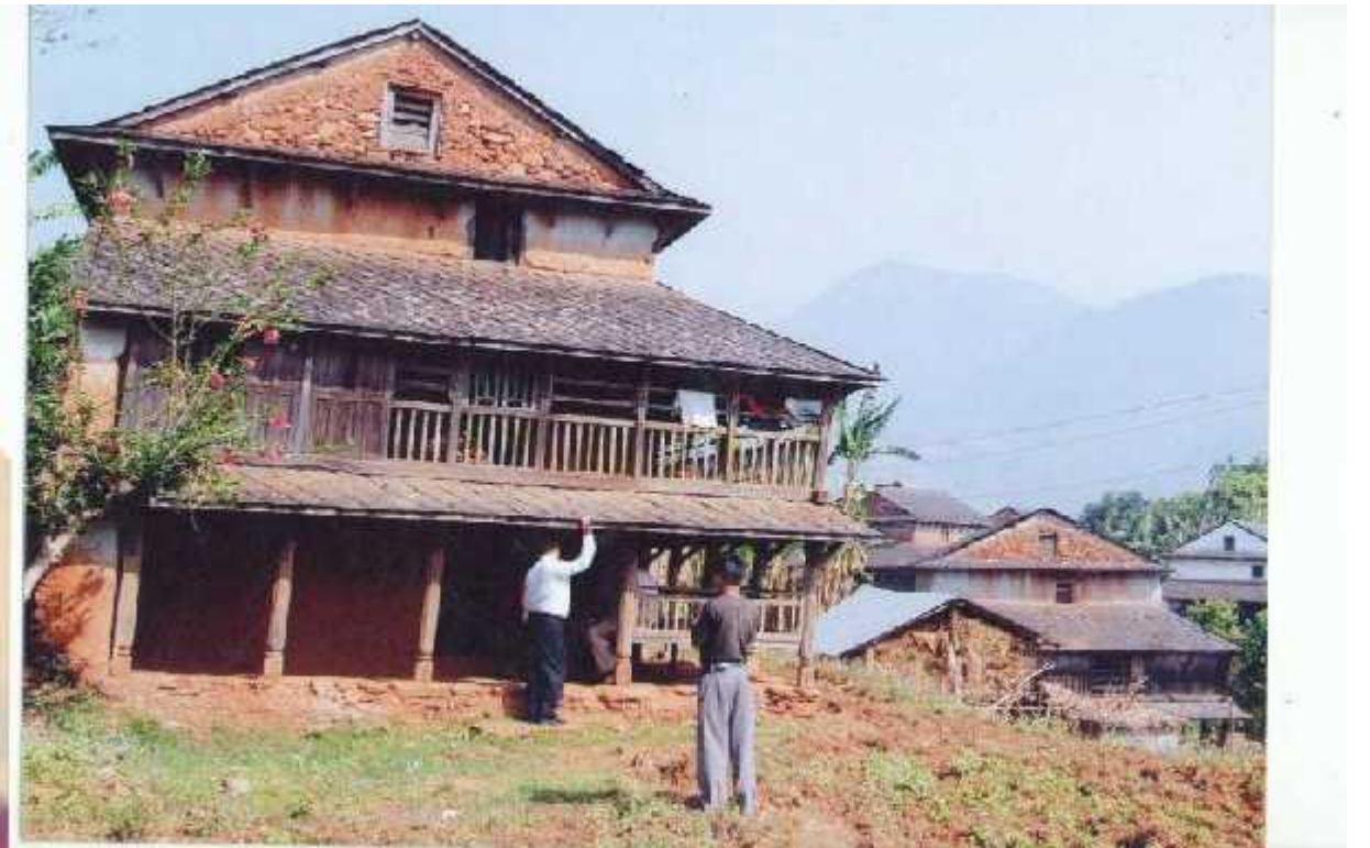
हुर्किने क्रममा कँडेलका बस्नु भएको घर (मलेखु, रिचोक्टार)