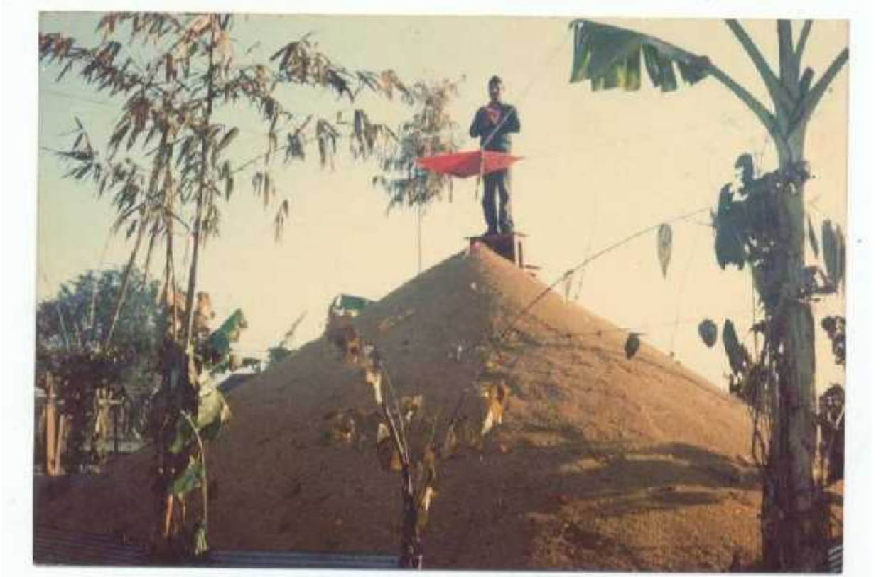
नारायणी विद्या मन्दिर उ.मा.वि. शिवनगरको धान्यञ्चल महायज्ञ समाप्तिपछि धानको रासमाथि कँडेल