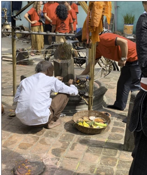
चित्र नं. ८ : कोटाल टोल, शिव मन्दिरमा पूजा