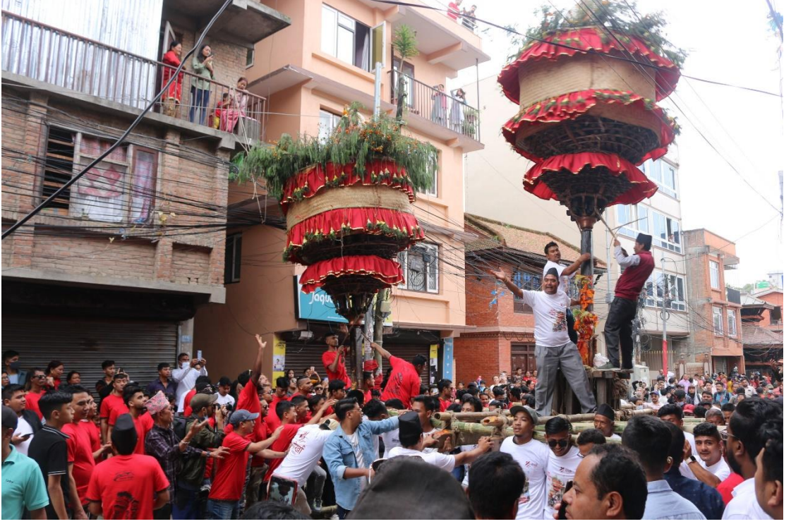
चित्र नं. २१ : जात्रामा रमाउँदै मानिसहरू