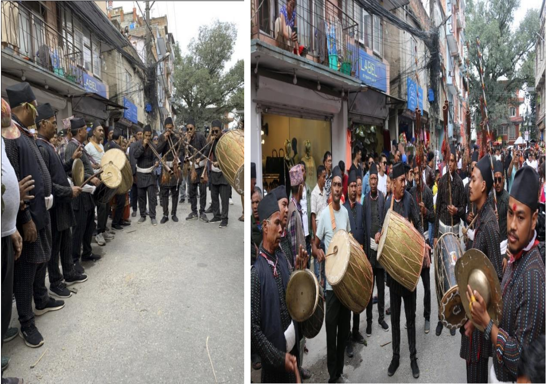
चित्र नं. १२ : खट उठाउन लाग्दा पैटा खलः बाजा बजाउँदै