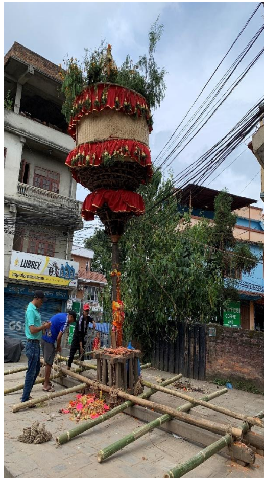
चित्र नं. ४ : जात्रामा प्रयोग गरिने खटको ढाँचा