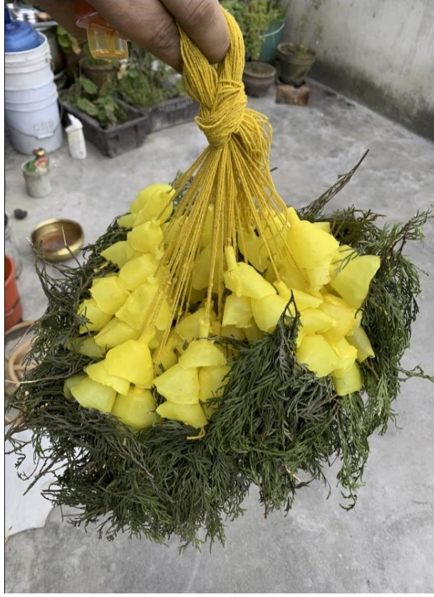
चित्र नं. ५ : जात्रामा प्रयोग गरिने मैनाको फूल