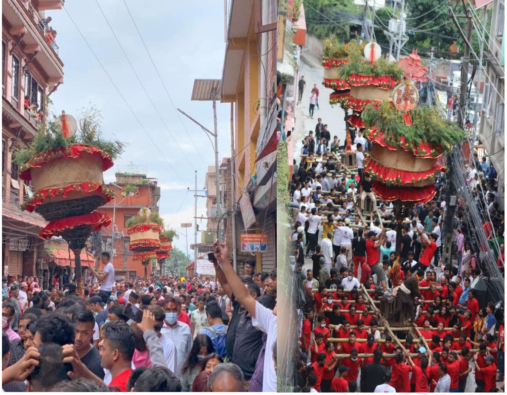
चित्र नं. १३ : जात्रामा ब्रह्मा, सत्यनारायण र महेशका खटहरु