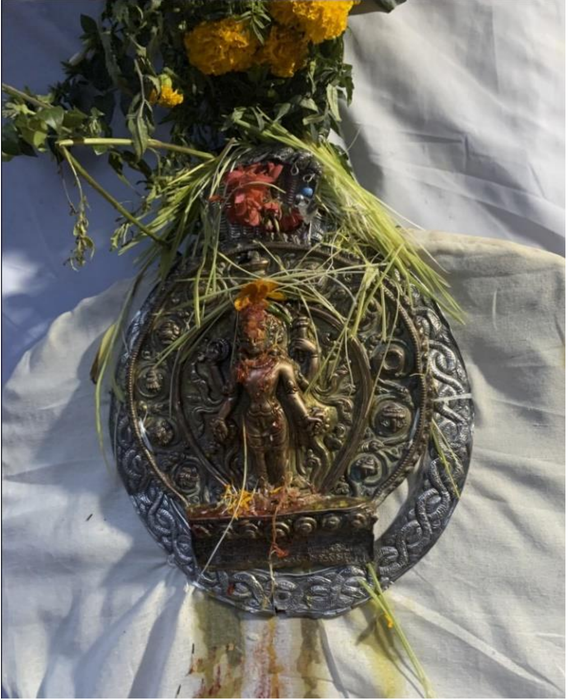
चित्र नं. १९ : बह्मा प्रीतक सत्यनारायण भगवान (जात्राको अवसरमा)