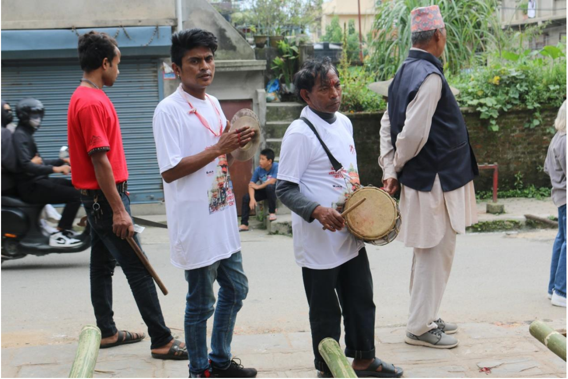
चित्र नं. ७ : जात्राको अवसरमा नायखी बाजा बजाउदै