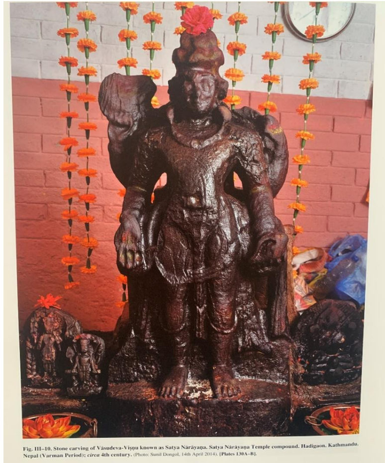
Fig. III-10. Stone carving of Vāsudeva-Viṣṇu known as Satya Nārāyaṇa. Satya Nārāyaṇa Temple compound, Hadigaon, Kathmandu, Nepal (Varman Period); circa 4th century. (Photo: Sunil Dongol, 14th April 2014). (Plates 130A-B).