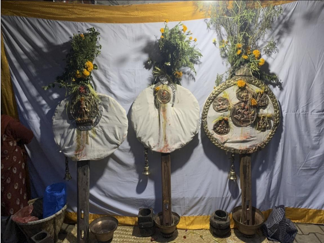
चित्र नं. ६ : ब्रह्मा, सत्यनारायण र महेश भगवानहरूको प्रतिमा