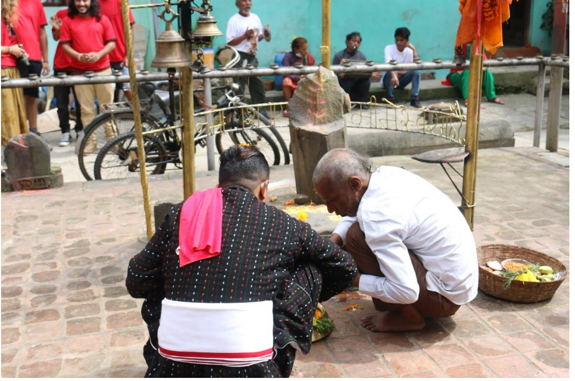
चित्र नं. ११ : राजभण्डारी पुजारीको (दाँया) सिकाइमा श्रेष्ठ पुजारी (बाँया) पुजा गर्दै