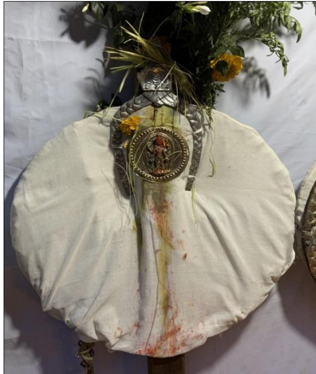
चित्र नं. १८ : सत्यनारायण भगवान (जात्राको अवसरमा)