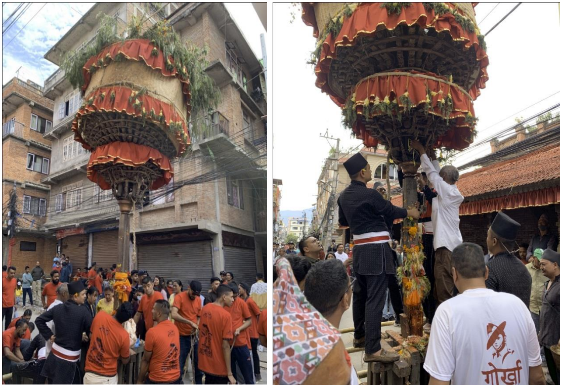
चित्र नं. १० : जात्रामा खट उठाउनु पूर्व खटको पूजा