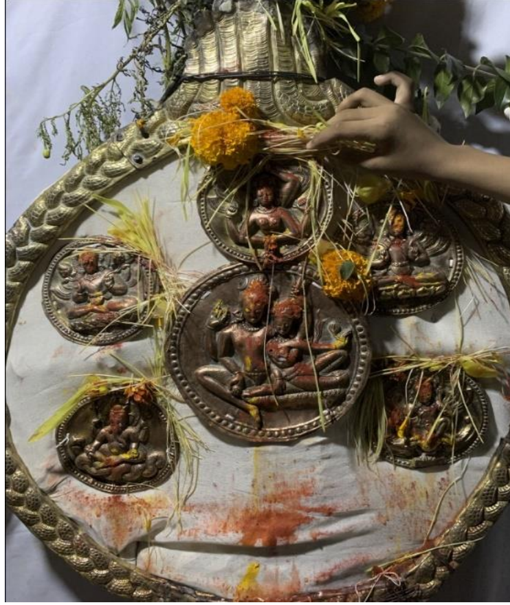
चित्र नं. १७ : उमा महेश्वर साथ सुर्य, चन्द्र, गणेश, कुमार र गंगा (जात्राको अवसरमा)