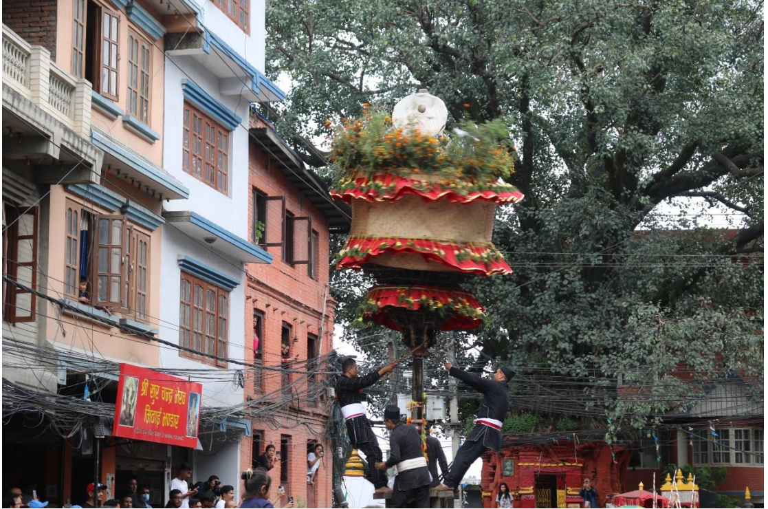
चित्र नं. १४ : जात्रामा खट घुमाउँदै