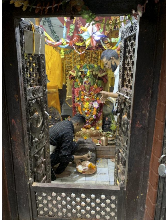
चित्र नं. १५ : हाडिगाउँ डवली तल सत्यनारायणको मन्दिरमा पूजा