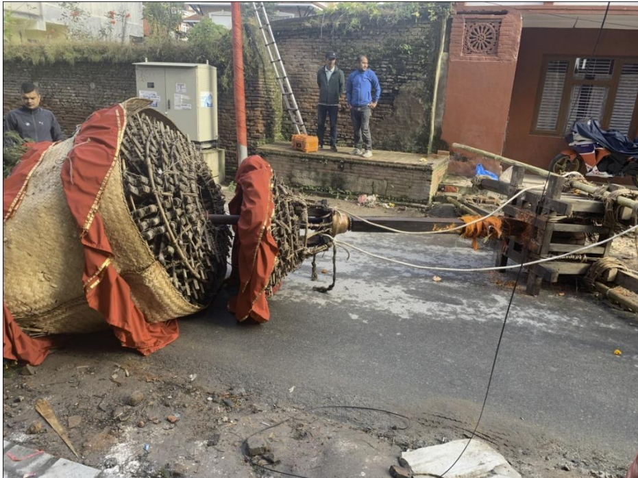
चित्र नं. १६ : जात्राको समाप्ती पछि खट लडाएको