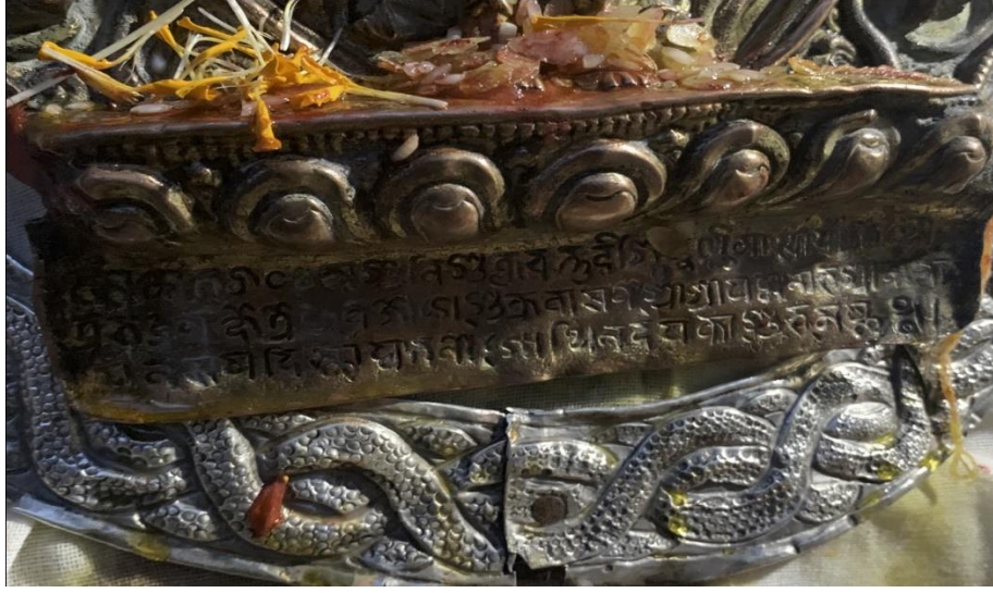
चित्र नं. १ : जात्रामा प्रयोग भएको ब्रह्माको मूर्ति फलकमा रहेको लेख