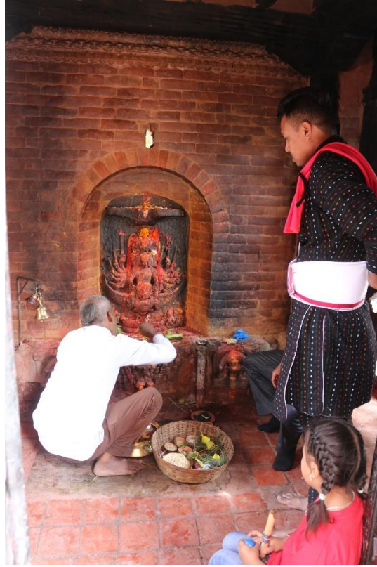
चित्र नं. ९ : कोटाल टोल, कुमारकार्तिकेयको मन्दिरमा पूजा