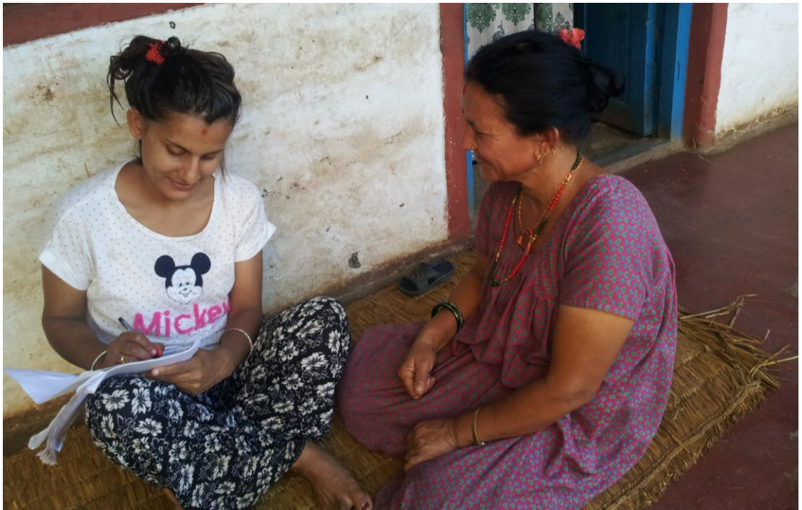
उत्तरदातासँग प्रश्न गर्दै अनुसन्धानकर्ता