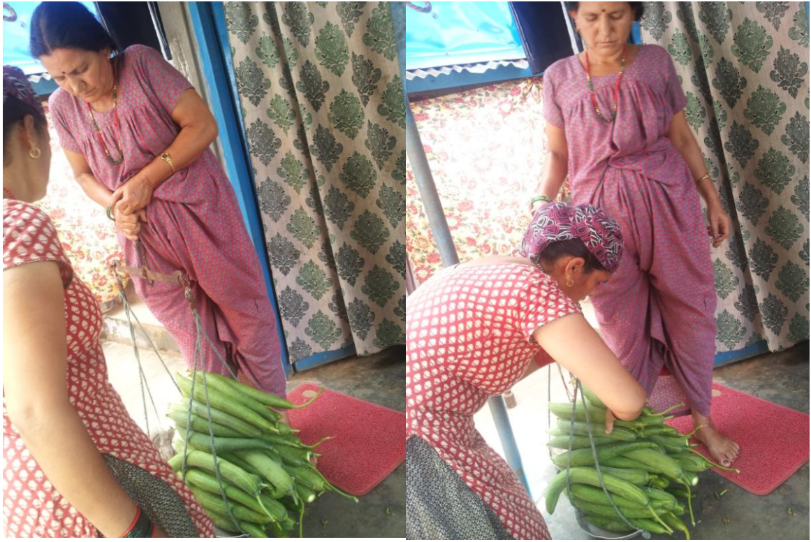
तरकारी बेचबिखनको अवस्था