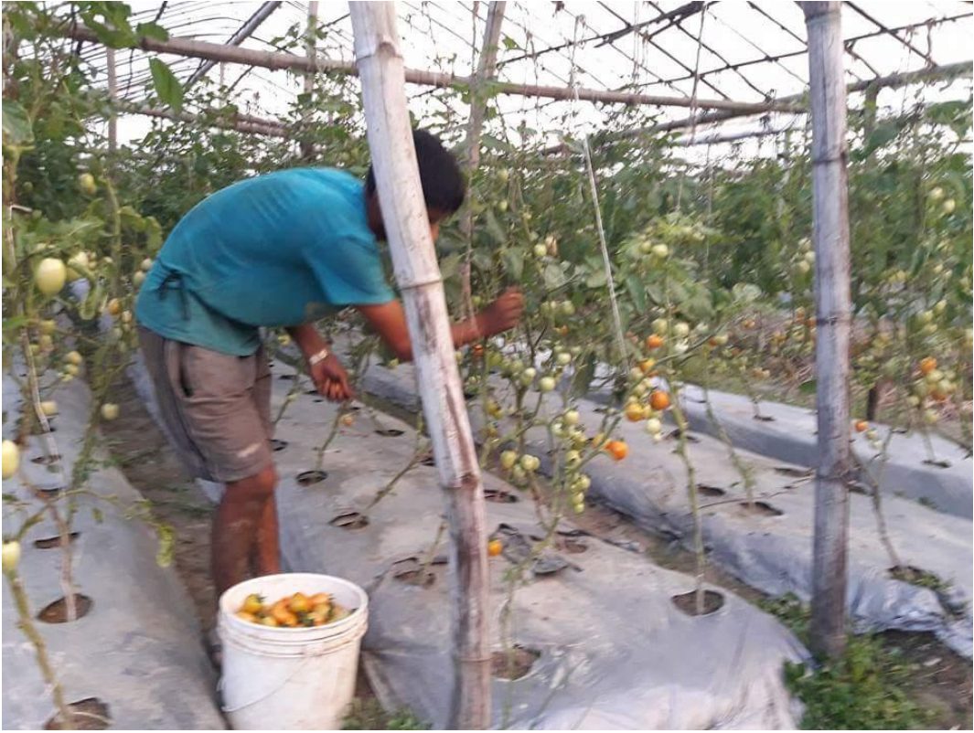
गोलभेडा खेती उत्पादन गर्ने टनेल