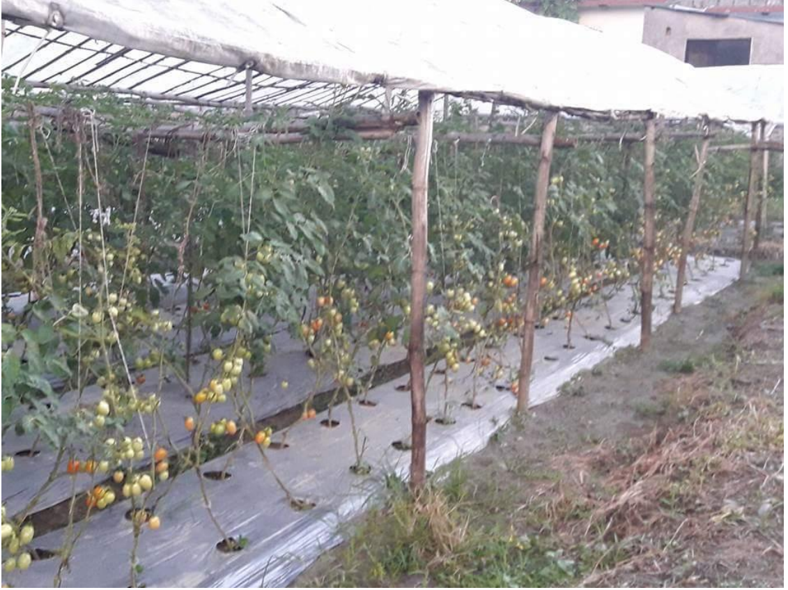
गोलभेडा खेती उत्पादन गर्ने टर्नेल