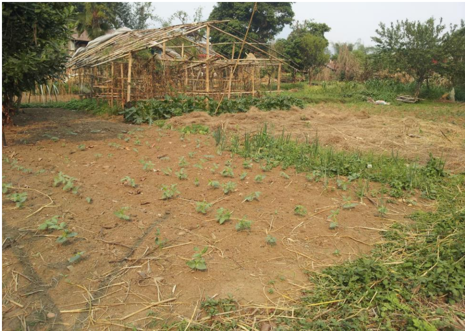
अन्य तरकारी रोपेको स्थान