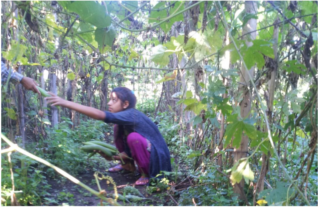
कृषकले तरकारी टिपिरहँदाको समय