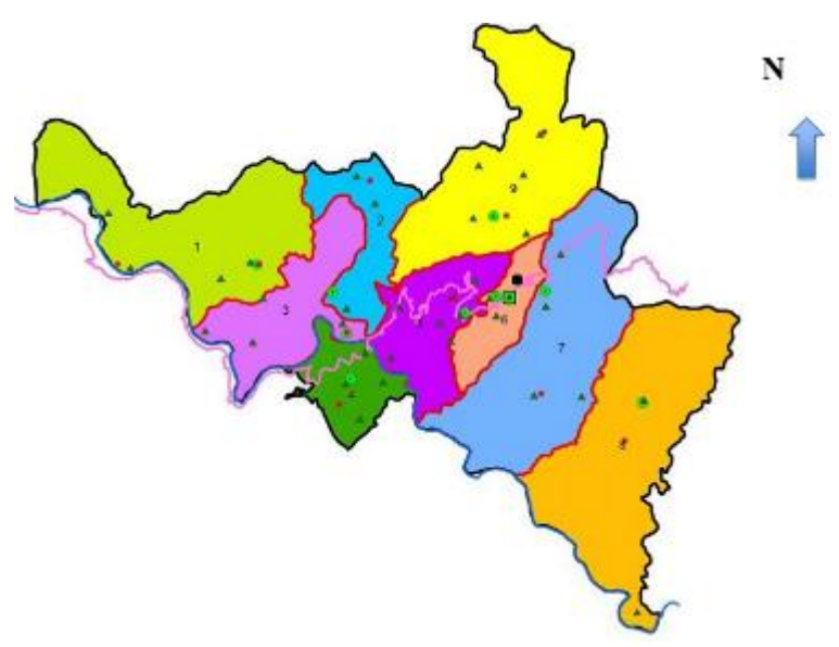
चित्र ३ पूर्वीचौकी गाउँपालिकाको नक्सा