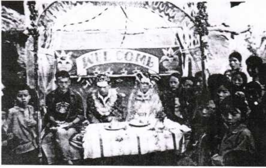
शुभ विवाहको आफन्तहरूका साथ शोधनायक