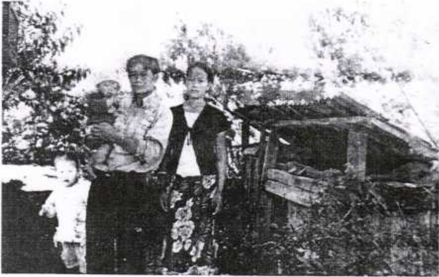
परिवारका साथ शोधनायक