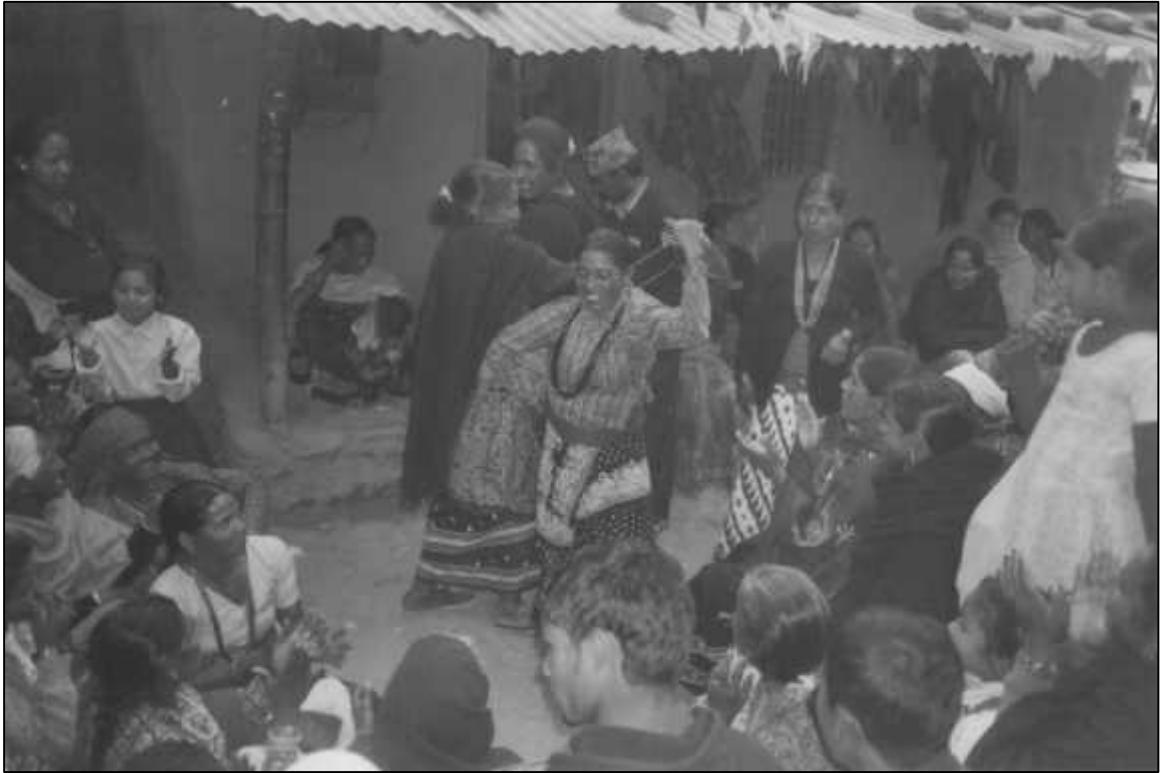
रत्यौलीमा नृत्य गर्दै महिलाहरू ।