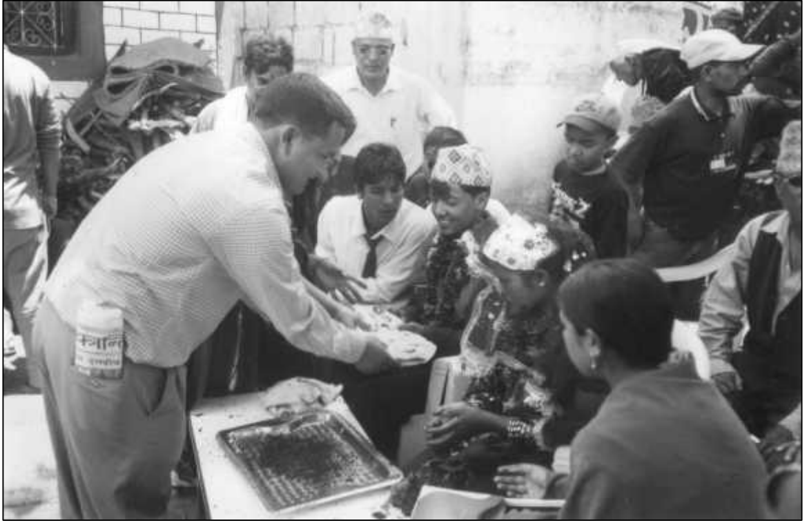
दुलाहा-दुलहीलाई आफन्तले टीका लगाउँदै ।