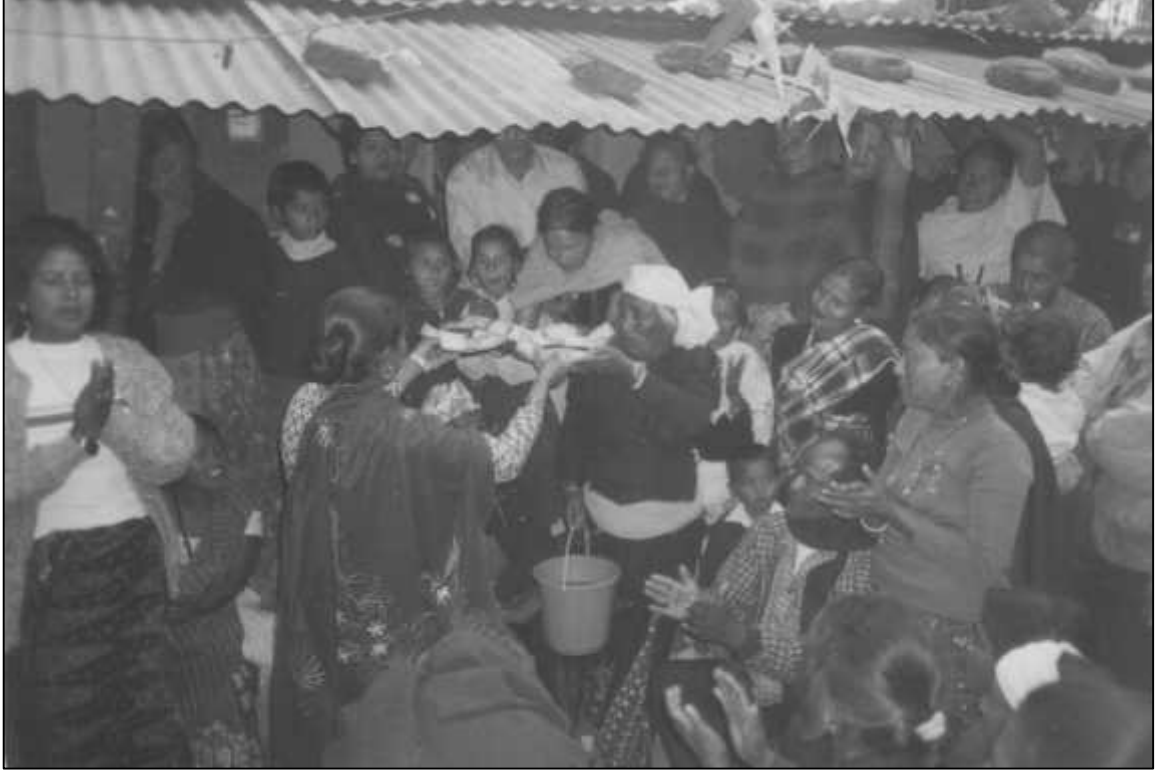
रत्यौली खेल्ने महिलालाई पैसा दिई ।