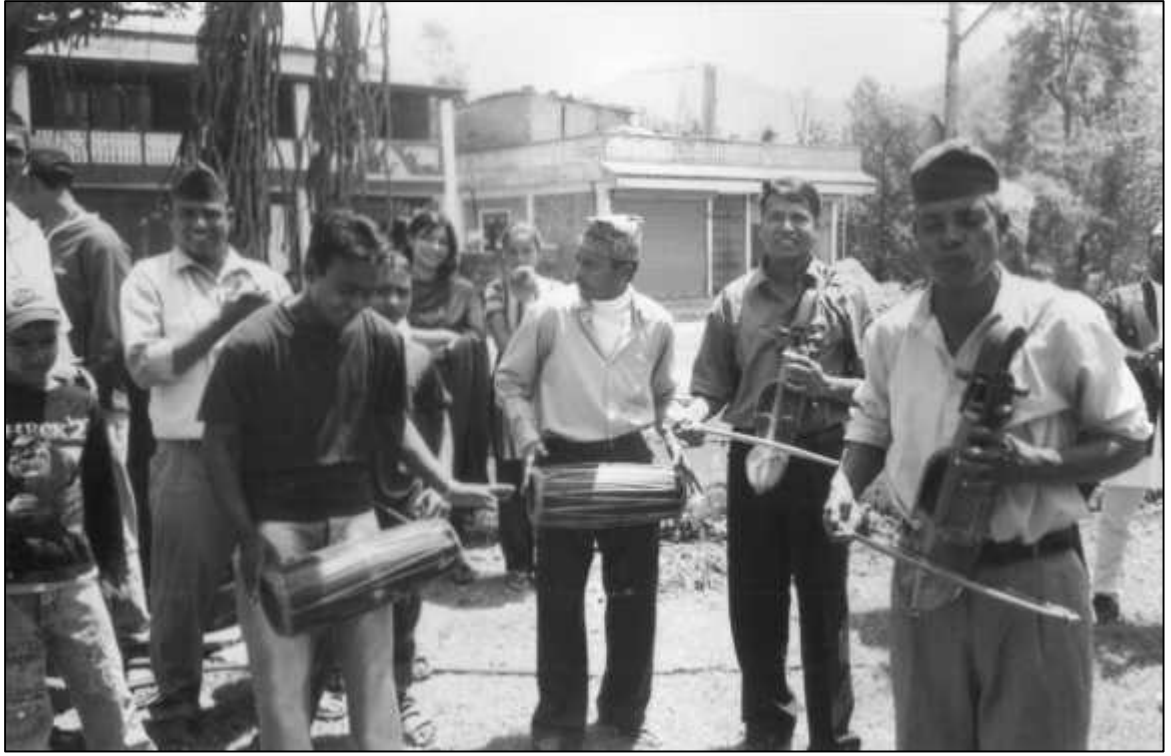
आफ्नो मौलिक बाजा बजाउँदै गन्धर्वहरू ।