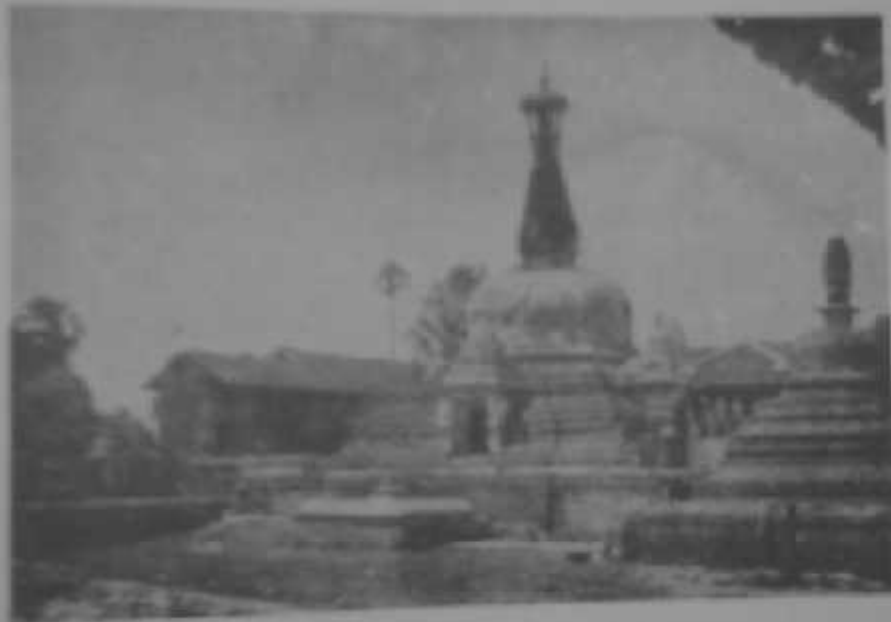
CENTRAL AGRA STUPA, PATAN