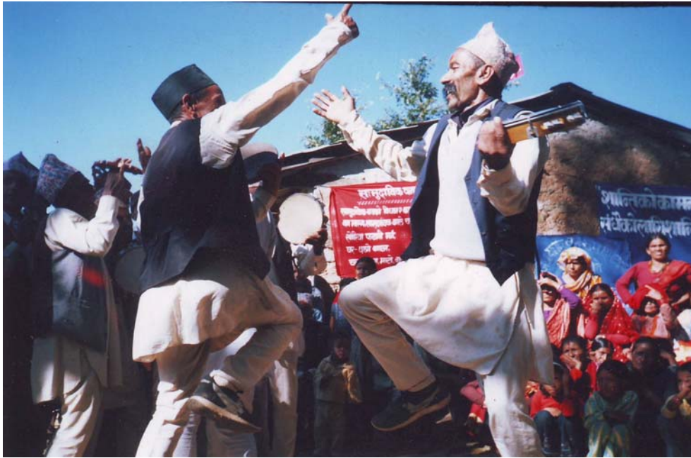
फोटो नं १०. वनसंरक्षणको सन्देश दिदै भजन गाउँदै बसाहाको हरियाली भजन समूह