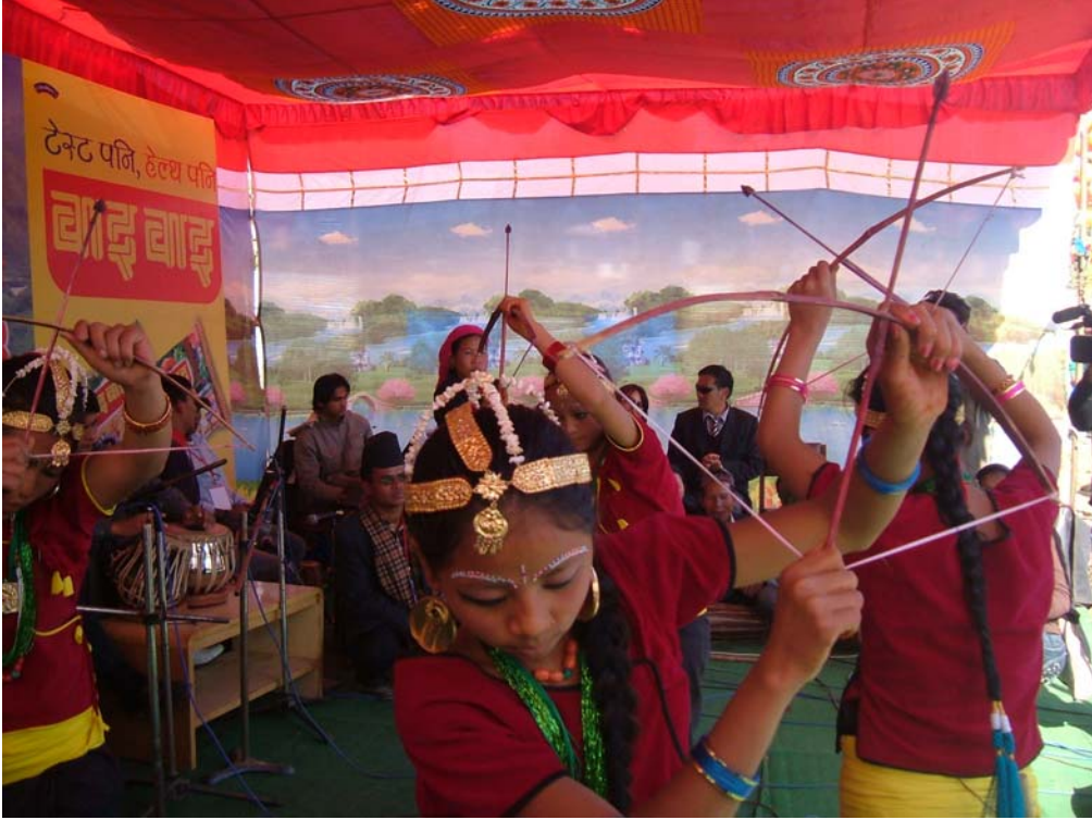
फोटो नं ५. धादिङ महोत्सव २०६४ को अवसरमा घाटुगीतमा नाच्यै गरेका सोह्रघरका