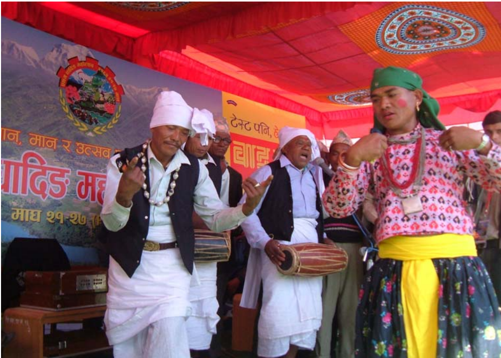
घाटुसारेहरु . धादिङ महोत्सव २०६४ को अवसरमा सोरठी गीत गाउँदै र नाच्यै गरेका साङ्कोष गा. वि. स. का गुरुबा, गर्रा र मारुनी