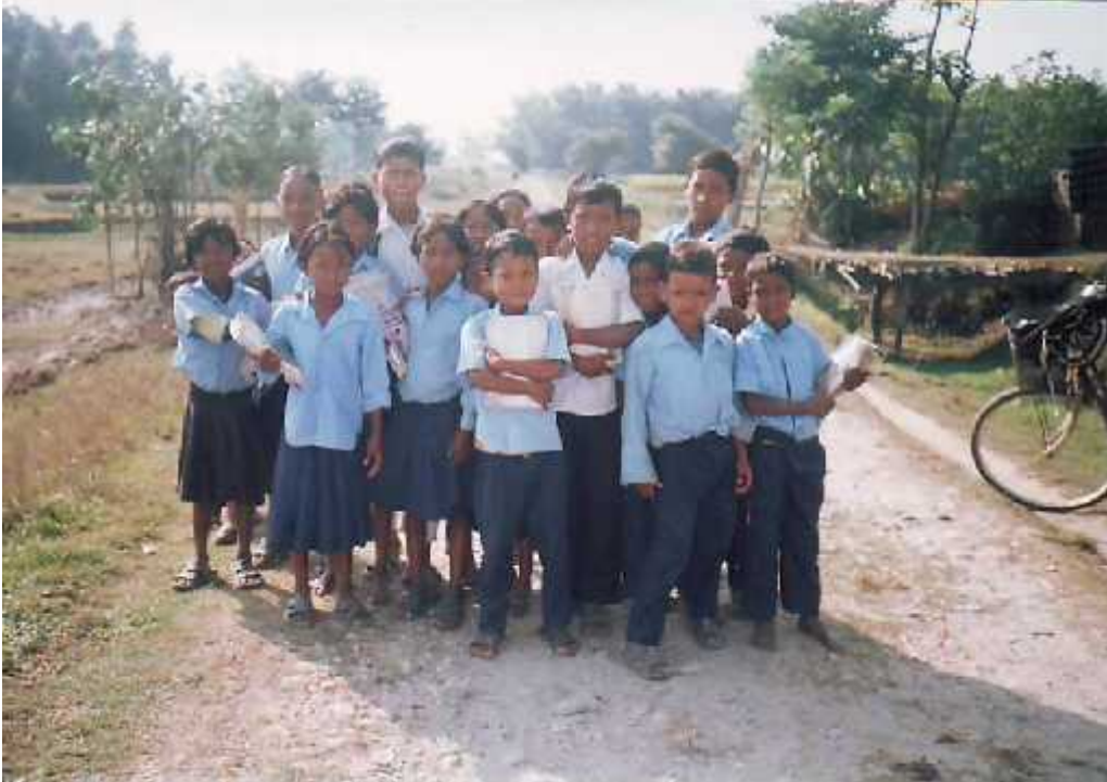
विद्यालय जाँदै गरेका राजवंशी विद्यार्थीहरु ।