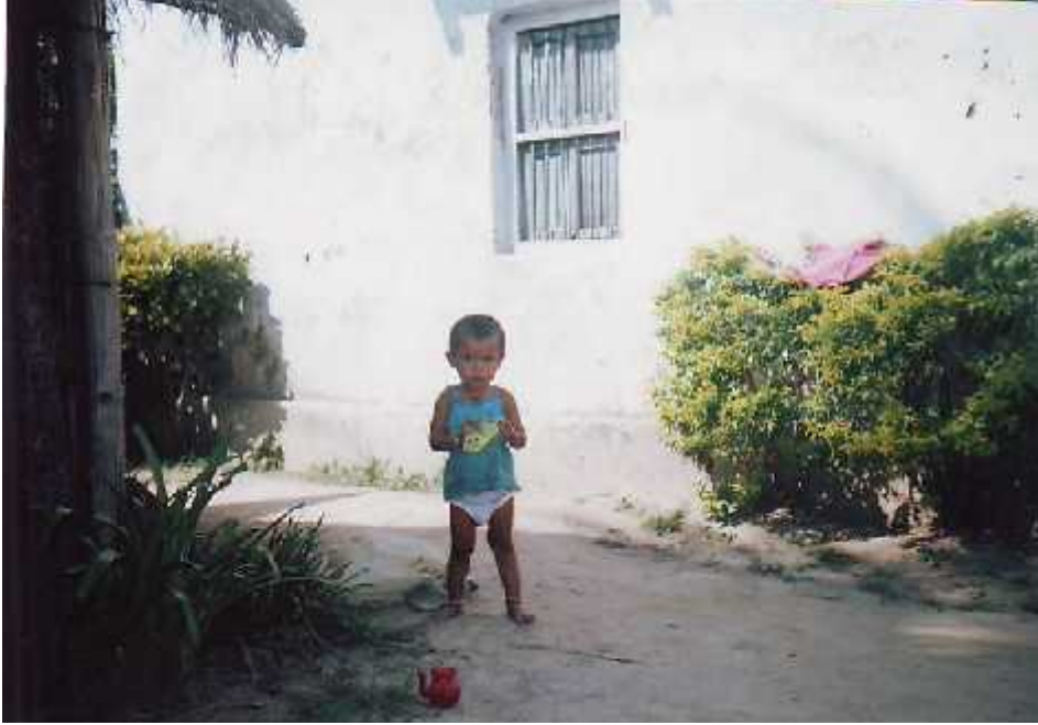
एक राजवंशी बालिका ।