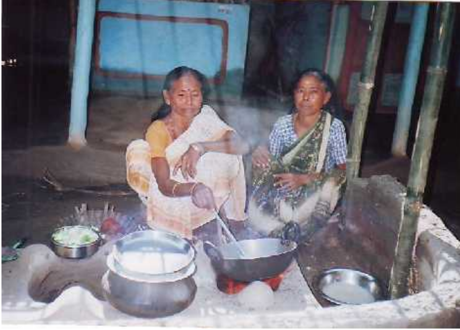
खाना बनाउदै राजवंशी महिलाहरु ।