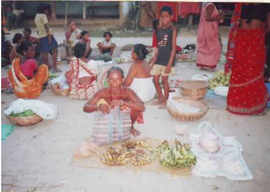
स्थानीय बजारमा सामग्री बेच्न ग्राहक कुरेर बसेकी राजवंशी महिला ।