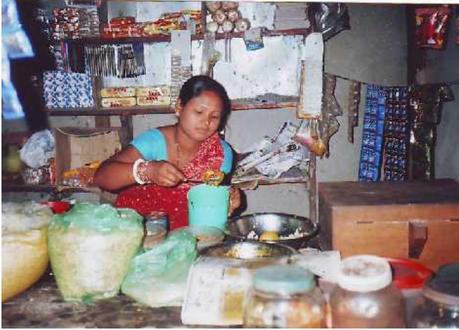
पसलमा चटपटे बनाउँदै एक राजवंशी महिला ।