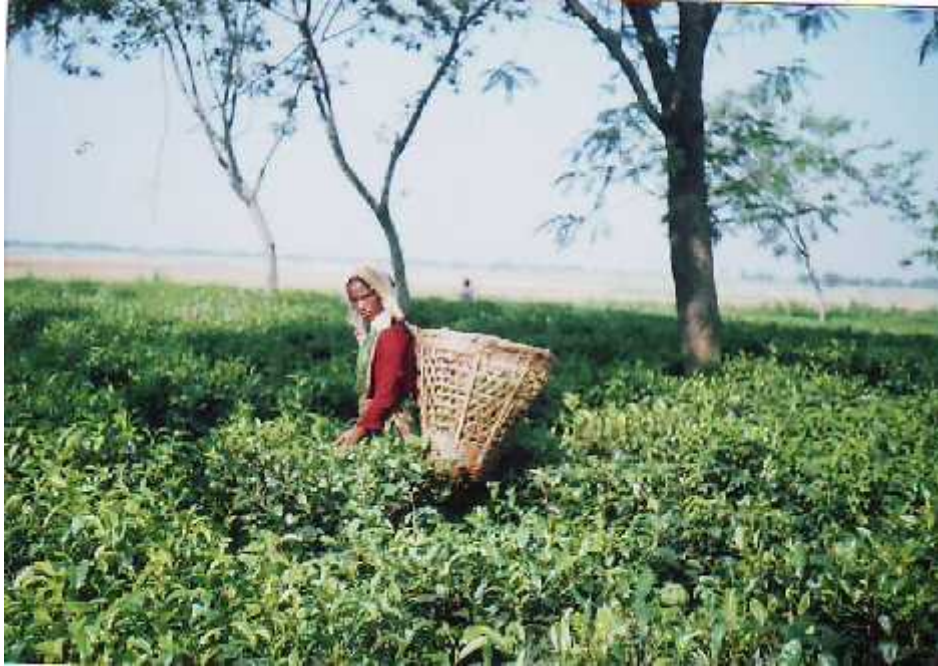
चिया बगानमा काम गर्दै एक राजवंशी महिला ।