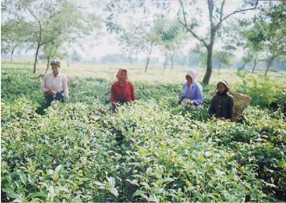
चिया बगानमा काम गर्दै राजवंशी समुदायका युवतीहरु ।