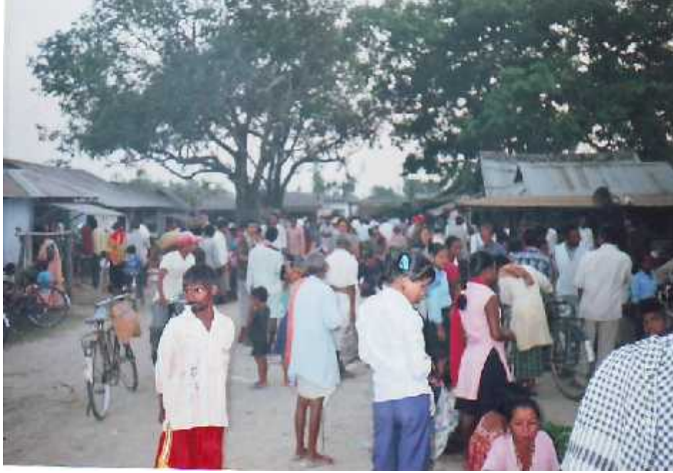
स्थानीय बजार ।