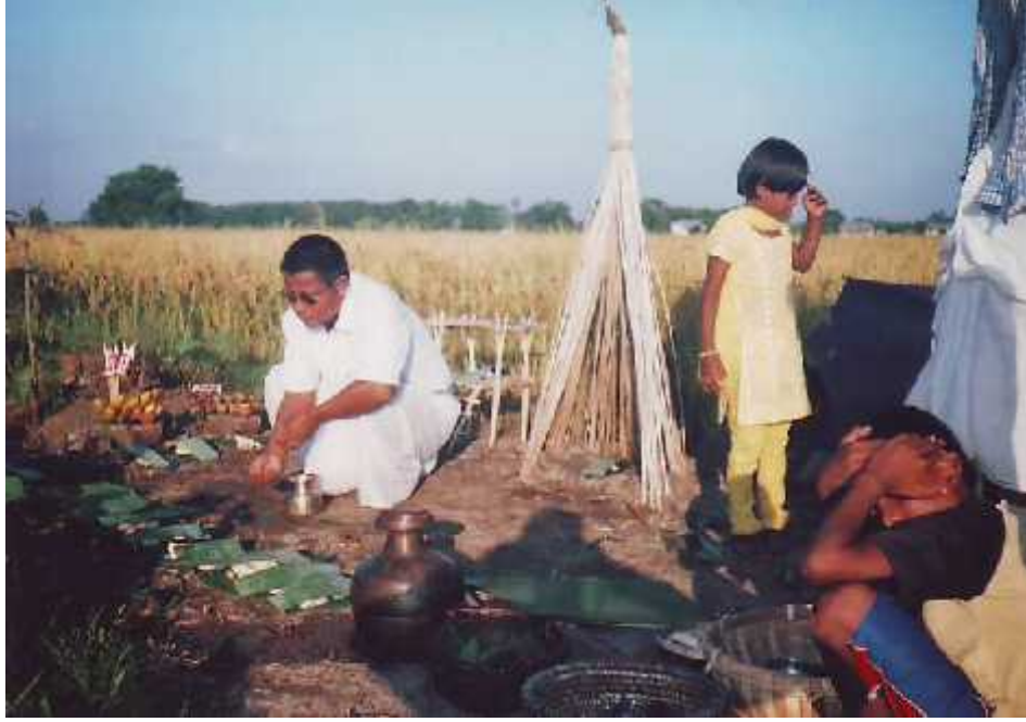
लक्ष्मीपूजा गर्दै एक राजवंशी पुरुष ।