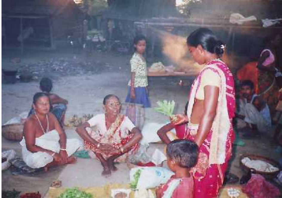
स्थानीय बजारमा सामग्री बेच्दै राजवंशी महिलाहरु ।