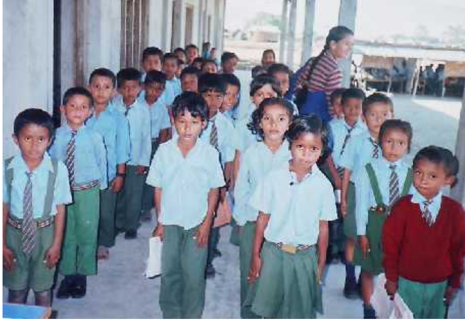
स्थानीय विद्यालयमा राजवंशी समुदायका बालबालिकाहरु ।