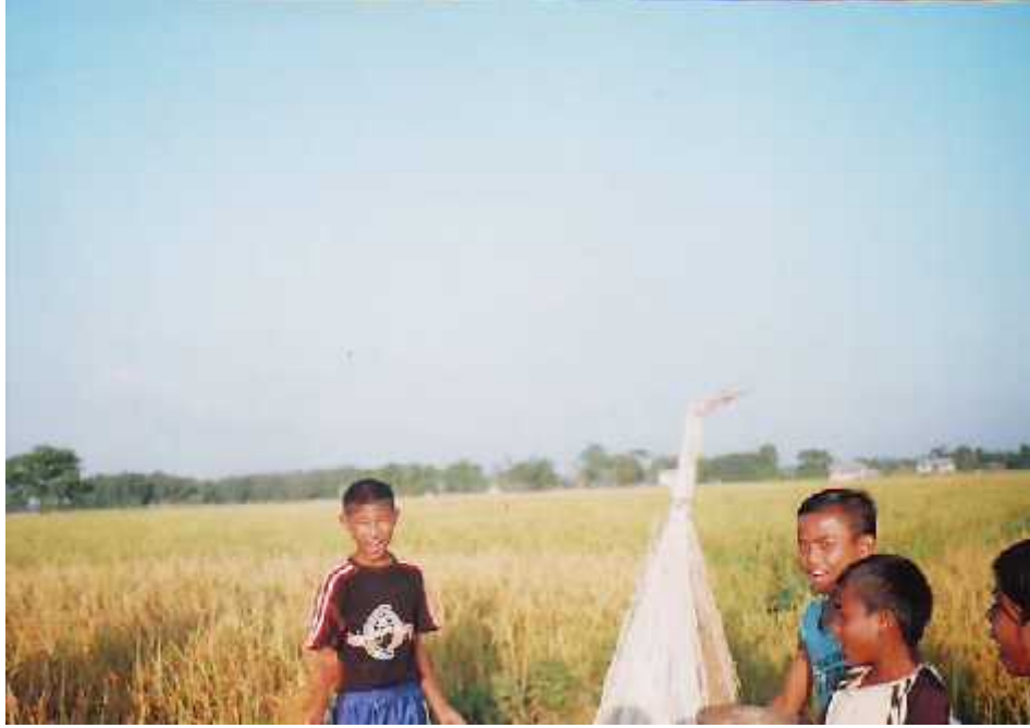
खेतमा पूजा गर्दै राजवंशी बालबालिकाहरु ।