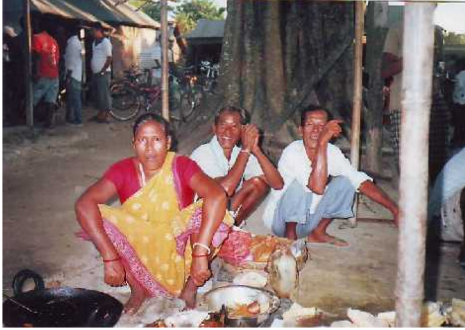
पापड बेच्दै राजवंशी महिला । साथमा अन्य पुरुषहरु ।