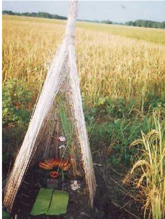
लक्ष्मीपूजाका लागि तयार गरिएको मन्दिर ।