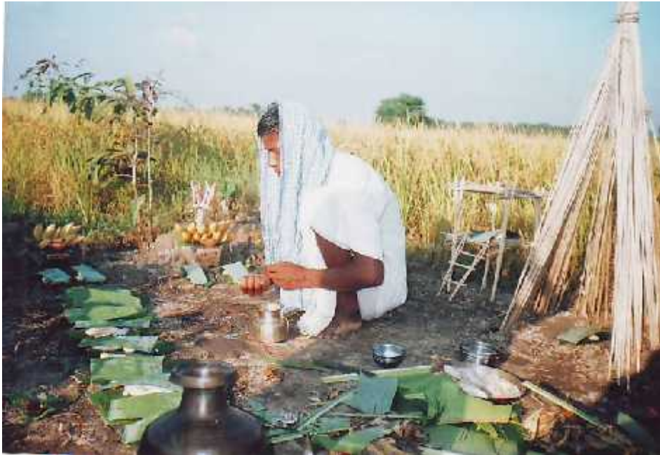
लक्ष्मीपूजा गर्दै एक राजवंशी पुरुष ।