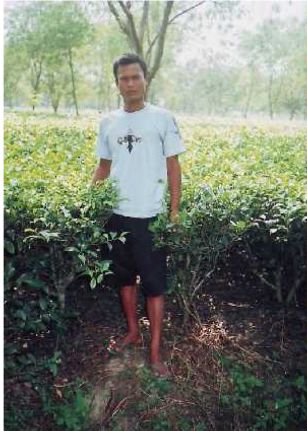
एक राजवंशी युवक ।