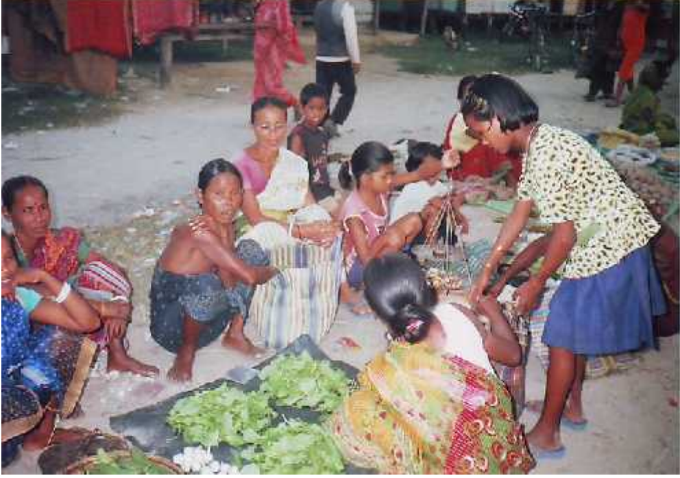
बजारमा सामग्री बेच्दै राजवंशी महिलाहरु ।