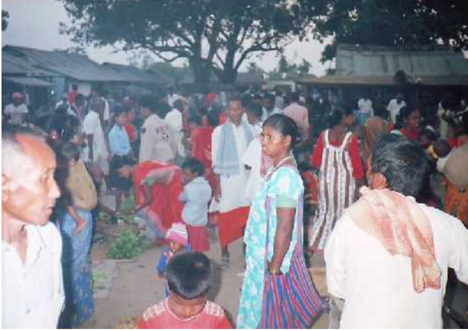
स्थानीय बजारमा राजवंशी समुदायका महिला पुरुषहरु ।