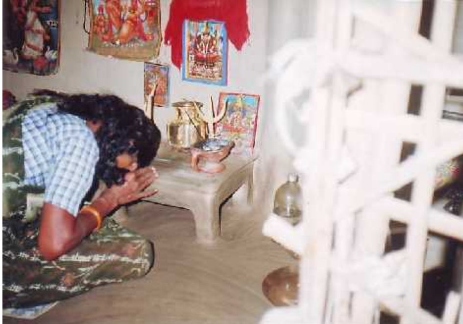
पूजा गर्दै एक राजवंशी महिला ।