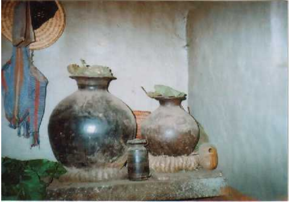
माछाकमा (दिछुम) र कठुवा