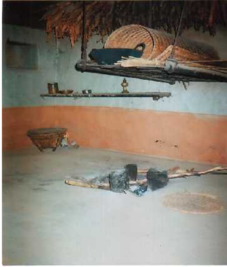
चुला (दायालुड) र डेसरी