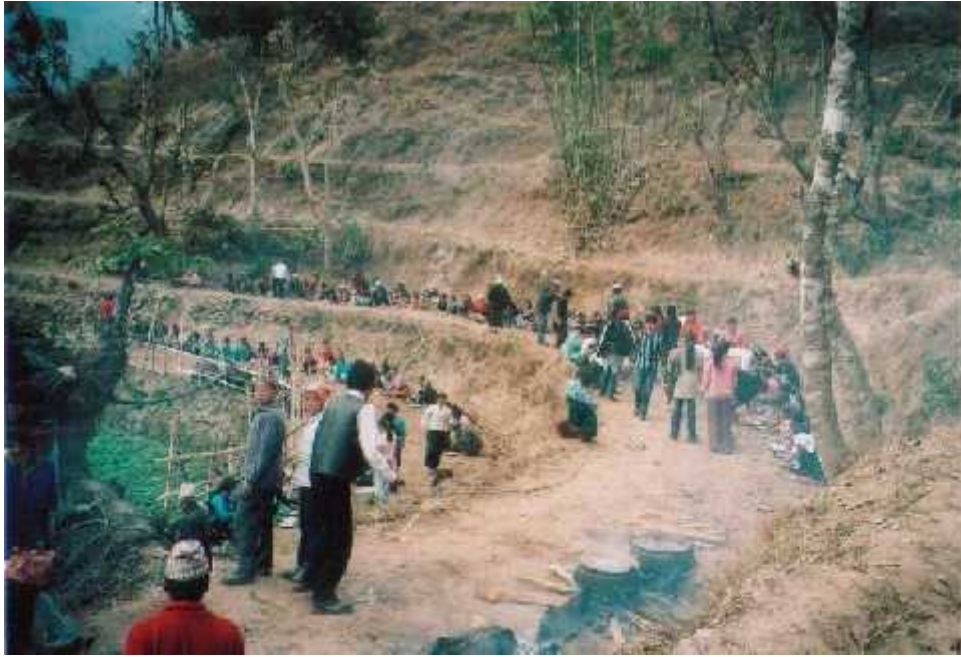
विवहमा भोज पकाउदै र खादै गरेको दृष्य