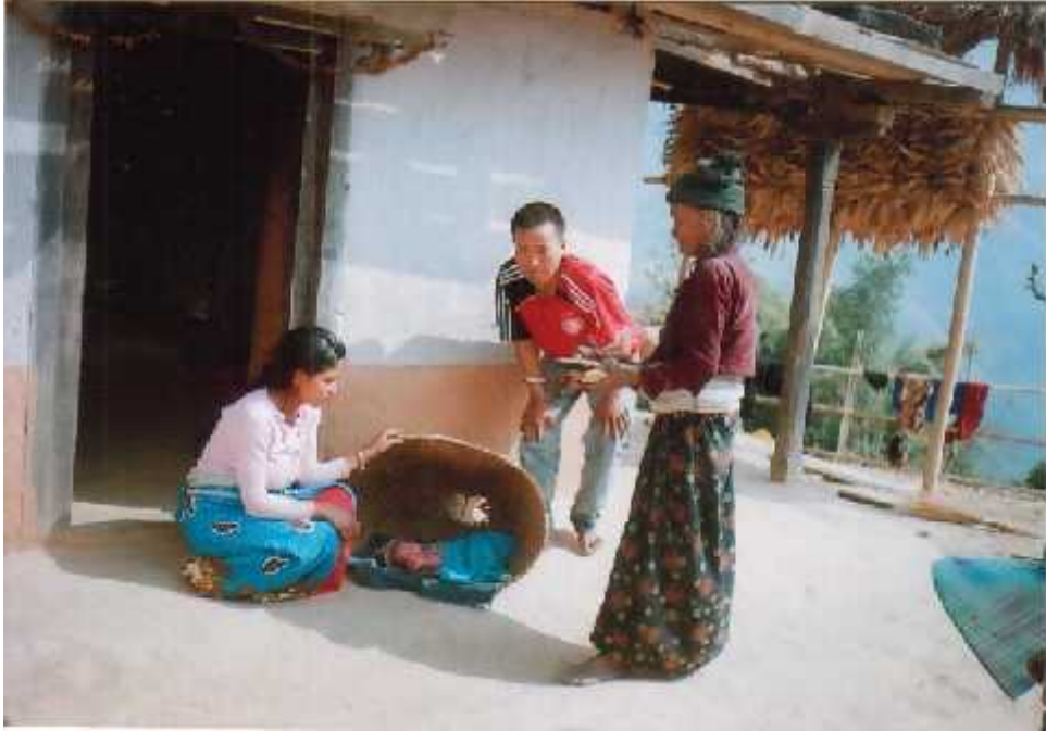
बच्चाको न्वारन गर्दै