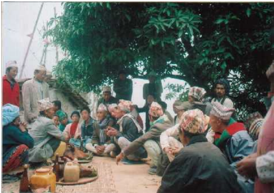
मावलीलाई सिर उभ्याउने राख्दै गरेको दृष्य