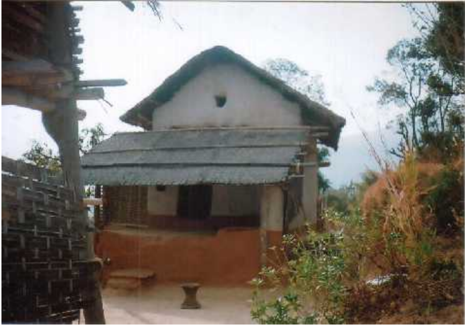
पुरानो परंपरागत घरको अगाडिको भाग