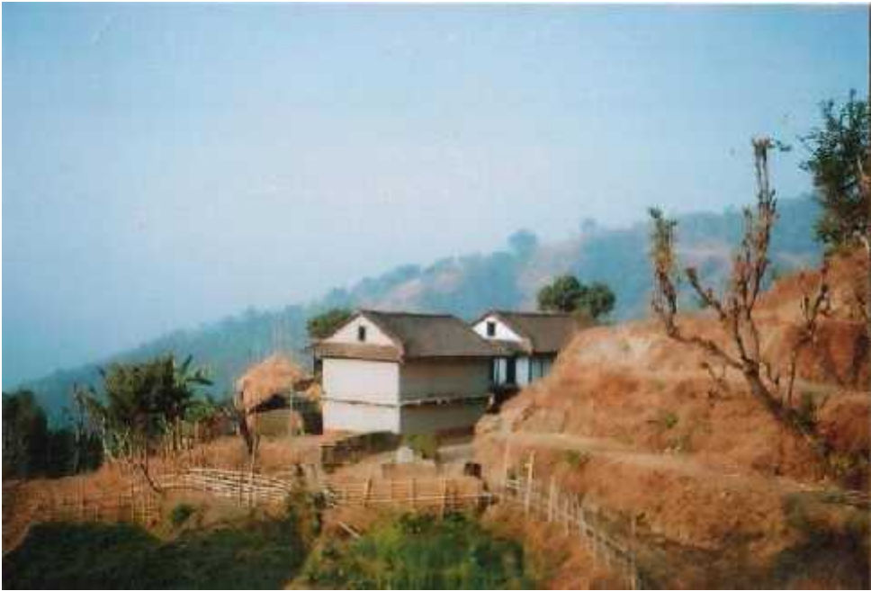
आजभोलीका आधुनिक घर