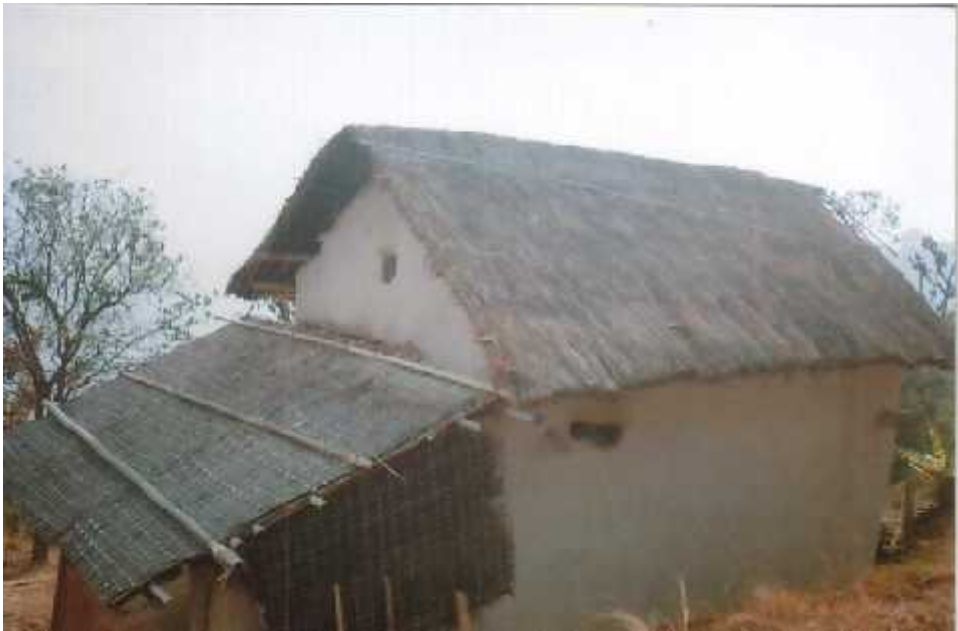
खरले छाएको परम्परागत घर