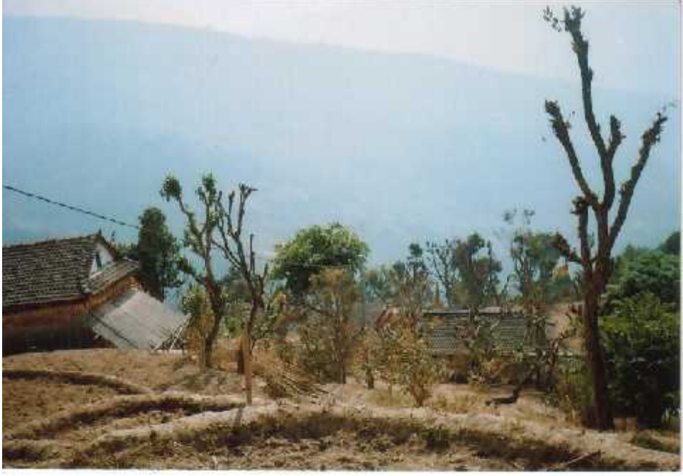
आजभोलीका घर तथा टोल