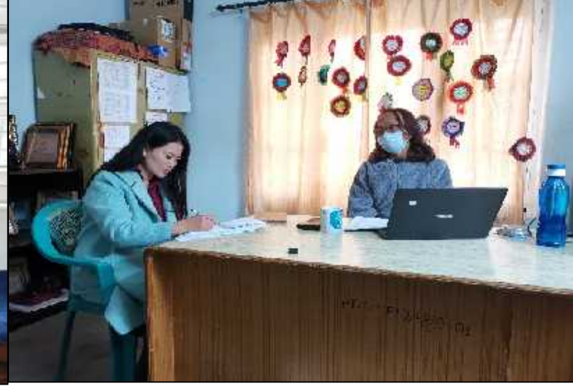
शोधकर्ता समलिङ्गी तथा तेस्रोलिङ्गी जोडीहरूसँग अर्न्तवार्ता लिदै