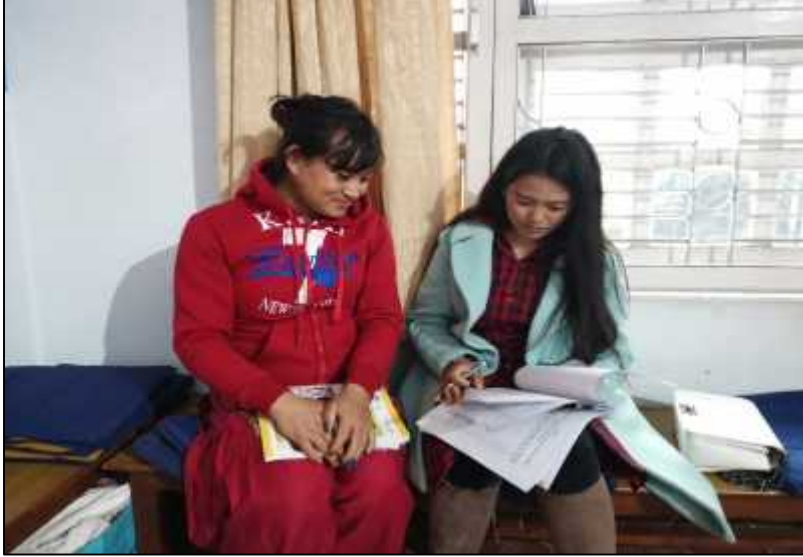
शोधकर्ता समलिङ्गी तथा तेस्रोलिङ्गी जोडीहरूसँग अर्न्तवार्ता लिदै