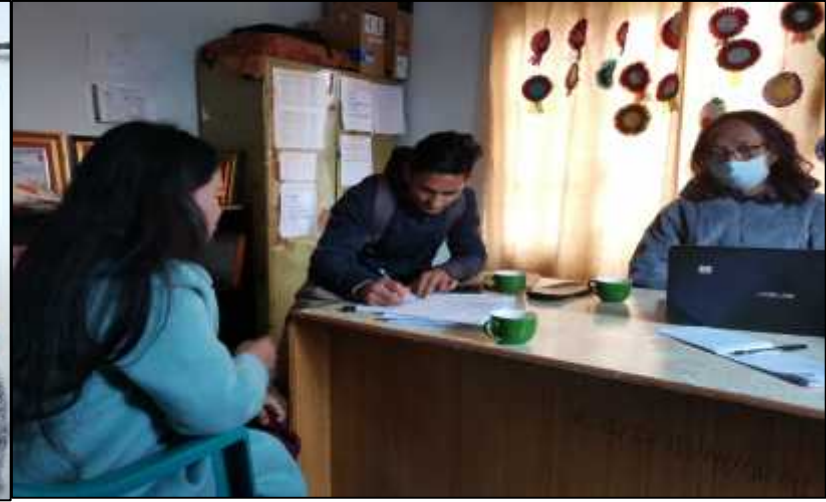
शोधकर्ता समलिङ्गी तथा तेस्रोलिङ्गी जोडीहरूसँग अर्न्तवार्ता