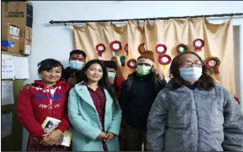
शोधकर्ता अर्न्तवार्ता पश्चात सामुहिक फोटो खिचाउँदै